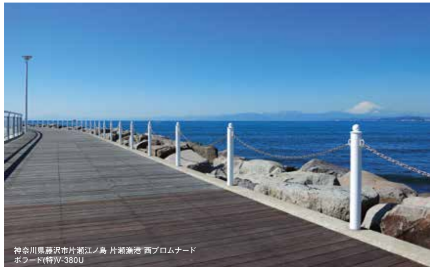
神奈川県藤沢市片瀬江ノ島 片瀬漁港 西プロムナード ボラード(特)IV-380U

本社 〒730-8667 広島市中区南吉島2-4-5 TEL: 082-244-4655 FAX: 082-243-5914 東京 〒105-0004 東京都港区新橋2-2-9 TEL: 03-3591-8501 FAX: 03-3591-8561 http://www.sunpole.co.jp